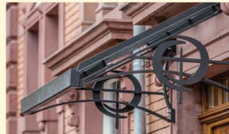
Johannes Klatt/TypeGrafix - Bild Kroztingen/Tunsel

Bitte orientieren Sie sich auch an der unten abgebildeten Straßenkarte.